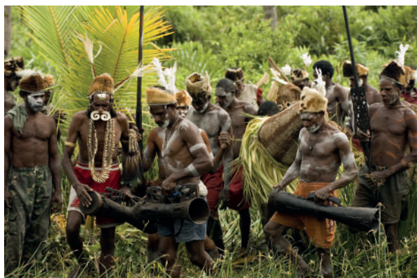
Het Wereldpaviljoen kreeg voorwerpen uit West-Papoea