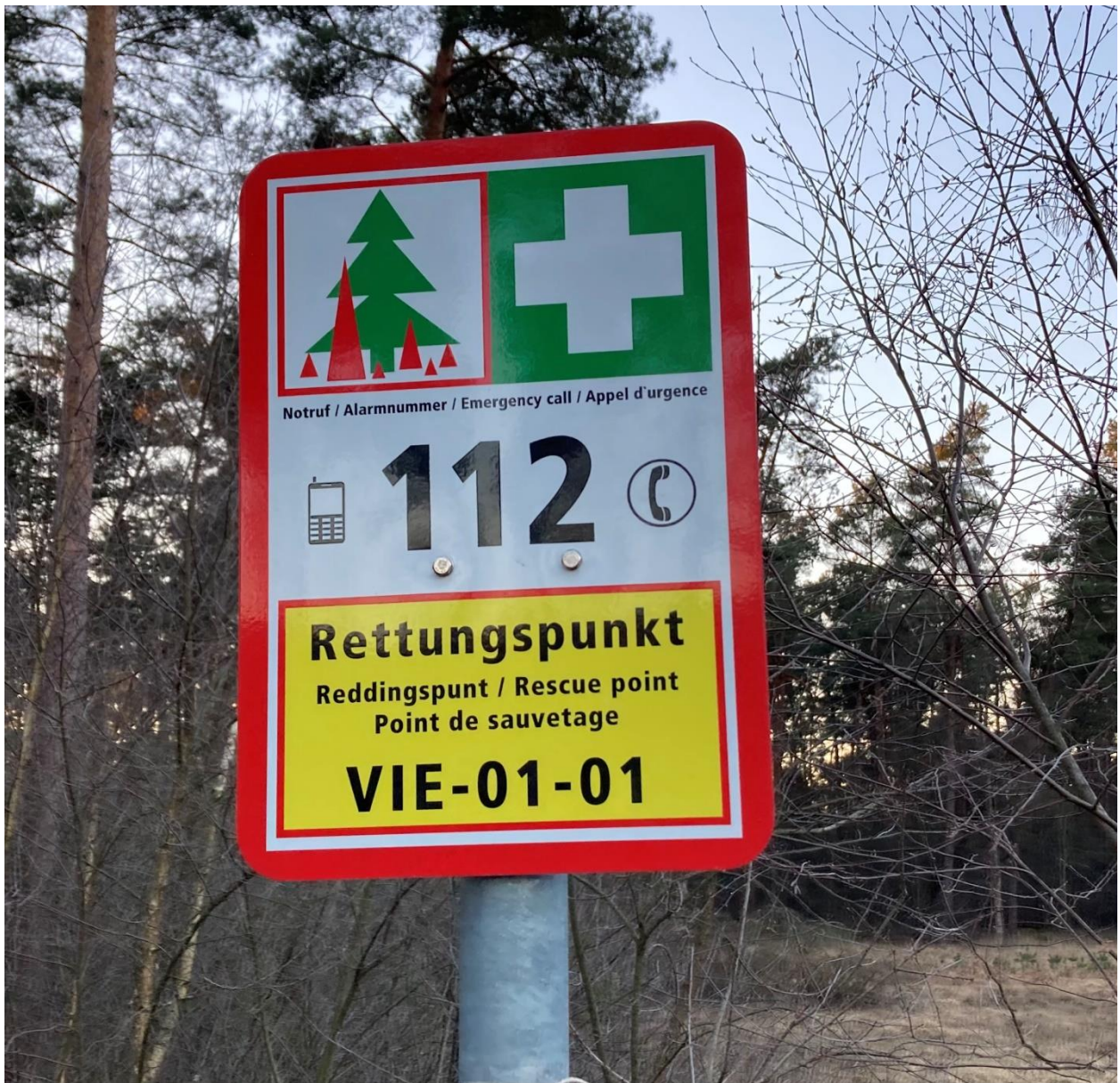
Reddingspunt vlak over de grens

De reddingspunten bevinden zich in het gebied van het Natuurpark Swalm-Nette. Het Grenspark Maas Swalm Nette is een Gemeenschappelijke Regeling waar ook Venlo in deelneemt.